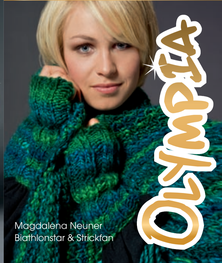
Magdalena Neuner Biathlonstar & Strickfan