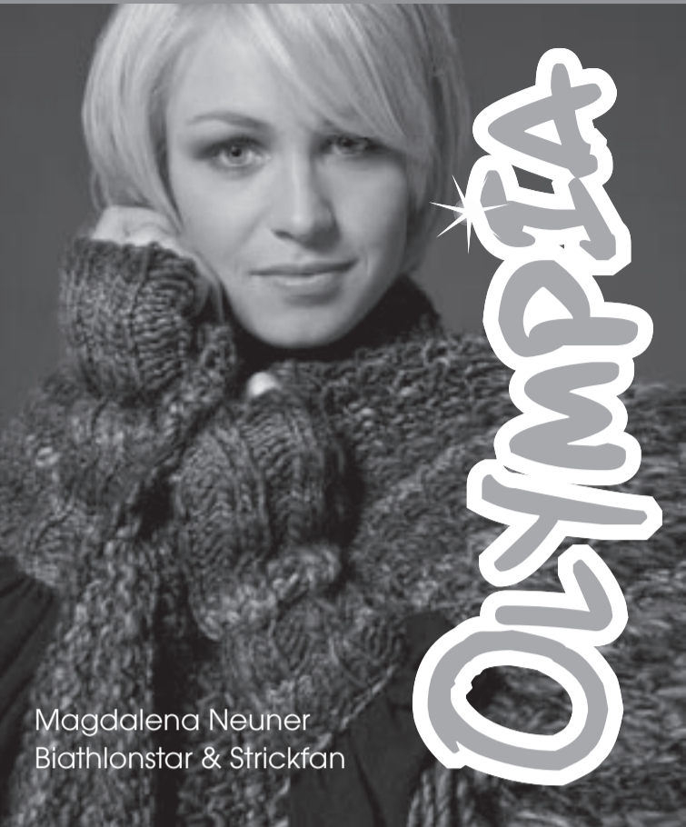
Magdalena Neuner Biathlonstar & Strickfan