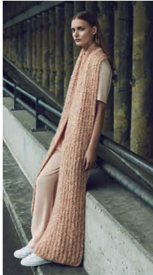
Seite 14 Schal: Styling: Niki Pauls, Make up: Manuela Kopp/Nina Klein, Hair: Krause/Kultartists, Model: Rakul Villeda/Unique Models